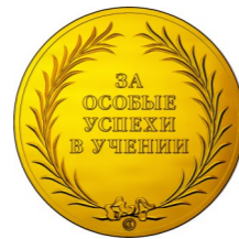
Образец медали «За особые успехи в учении»